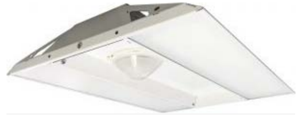
Luminaires CLE

Solutions s'engageant préalablement à réaliser 75 % d'économie d'énergie chaque année pendant 5 ans. Le retour sur investissement est alors inférieur à 3 ans.