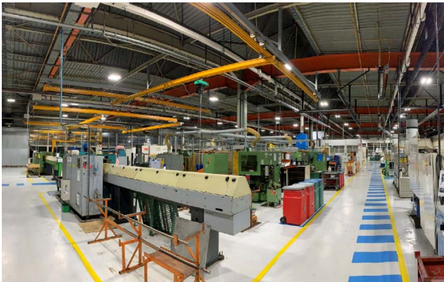
Projet industriel avec luminaires CLE éligible CEE.

Qualifiée RGE étude, EAS solutions propose aux professionnels une offre de