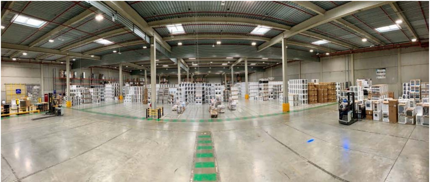
Projet tertiaire avec luminaires Lumaz éligible CEE.

Le projet concerne la rénovation de l'éclairage d'une base logistique dédiée au commerce d'une superficie de 40 000 m 2 . L'étude préalable de dimensionnement menée par EAS Solutions préconise la mise en place de 534 solutions LED intelligentes de 147 W avec détection de présence et de luminosité.